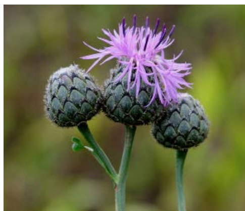
Eine sehr beliebte Futterquelle: Skabiosen-Flockenblume

Die Fläche befindet sich an der alten B17, einem Teil der „Romantischen Straße“. Um diesem Namen gerecht zu werden, sollte die Natur eine große Bedeutung spielen. Mit einem artenreichen und zur Blütezeit bunten Magerrasen kann zumindest ein Teilstück dieser Straße dazu beitragen. Aus Liebe zur Natur und um dieses Biotop für bedrohte Tiere und Pflanzen zu erhalten, pflegen die Aktiven der Kreisgruppe die Fläche. Jährlich sind sie als Ersatzschafe tätig, um Überwucherung und Verbuschung zu verhindern: Sie mähen die Wiese per Hand, rechen und entfernen die Mahd. Flora und Fauna danken es ihnen. Arten der Roten Liste, wie der Gekielte Lauch ( Allium carinatum ) oder die Labkrautblättrige Wiesenraute ( Thalictrum galioides ), fühlen sich dort wohl. Aber auch Regensburger Geißklee ( Chamaecytisus ratisbonensis ) und die Knäul-Glockenblume ( Campanula glomerata ) kann man auf dieser Fläche finden.