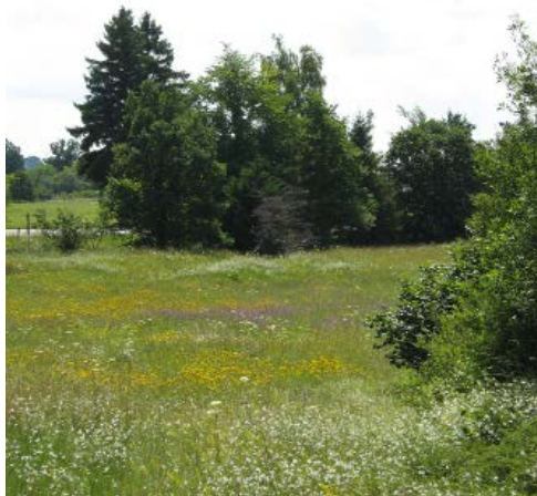
Biotop an der Welschen Straße