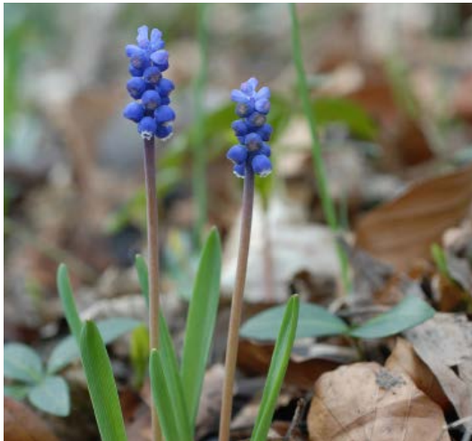
Im Frühjahr kaum zu übersehen auf der Fläche vom Lechhang - die Traubenhyazinthe.